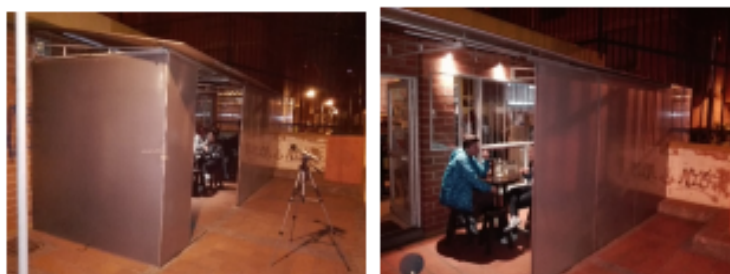
Fotos 4 y 5. Fachada